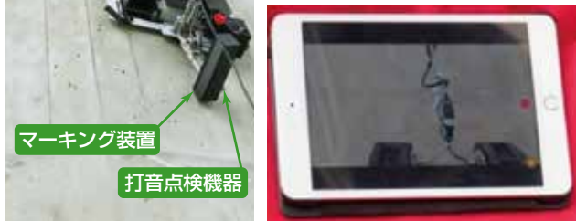
壁昇降点検ロボットイメージ