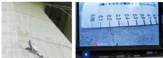
橋脚壁面(ひびわれ幅0.2mm程度)のスキニング画像