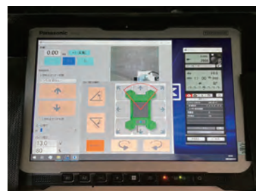
● 専用コントローラー

※NEXCO 3社が使用を認めた、高解像度カメラを搭載した空中撮影型の点検支援技術です。