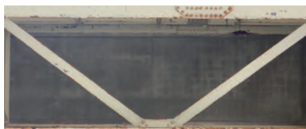
ラテラルを回避した撮影が可能