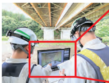
● 点検員によるライブビュー点検状況