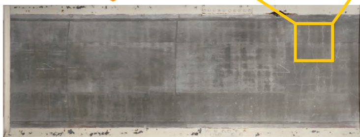
● 床版下面撮影画像の合成処理