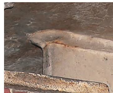
● 溶接部の塗膜割れ